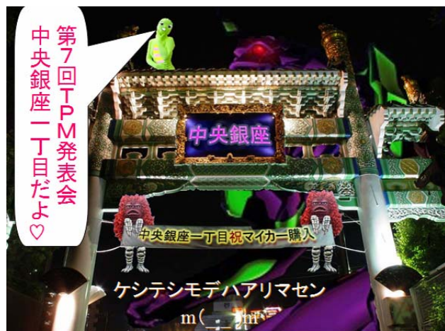
第7回TPM発表会 中央銀座1丁目だよ♡

優勝するために最低限必要なことをしたまで！！って感じの活動・プレゼンでした。洗練された団結力のあるサークルです。T課長が御結婚され、愛のパワーも感じられます。